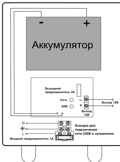
Схема подключения источника согласно рис. 1